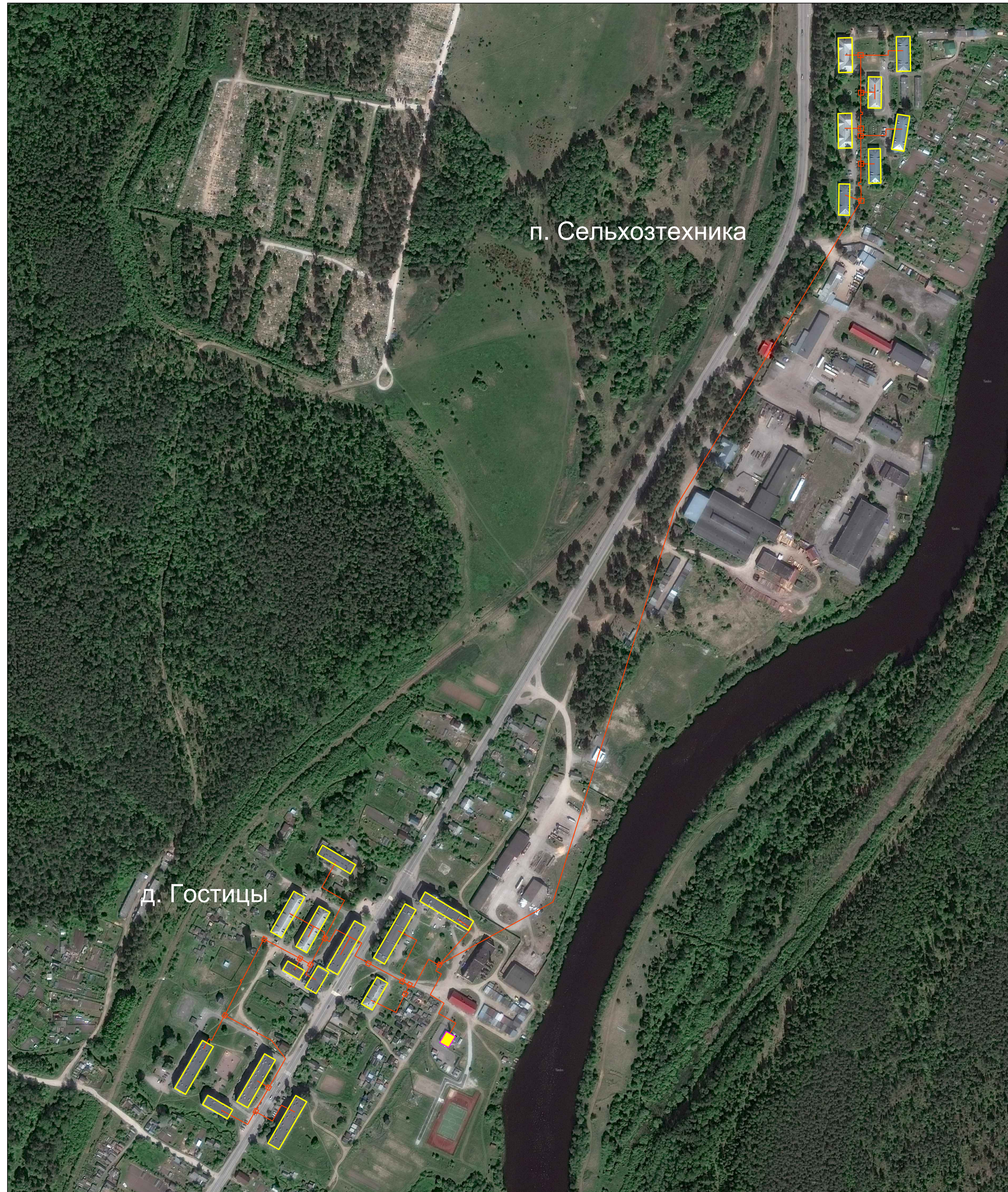
Границы сельского поселения

Схема существующего и планируемого теплоснабжения д. Гостицы, п. Сельхозтехника фрагмент территории