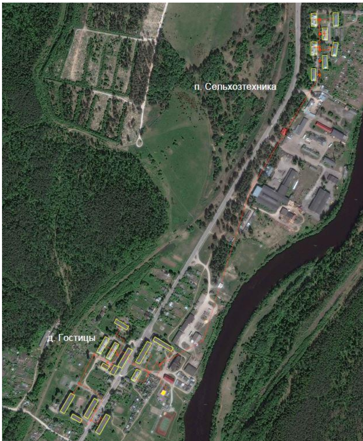
Рисунок А.1 – Тепловые сети