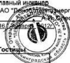
Температурный график работы котельной БМК - 7,2 МВт, п. Гостицы