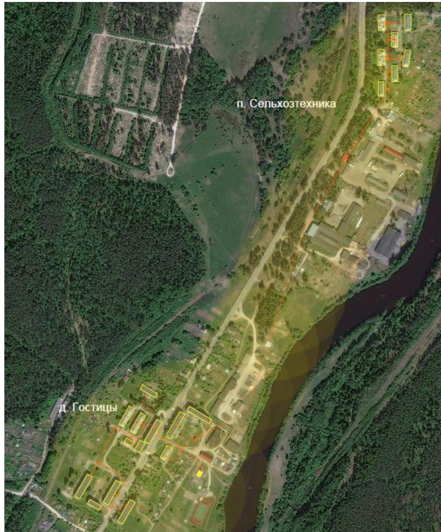
Рисунок 1.1.1. – Функциональная структура теплоснабжения муниципального образования Гостицкое сельское поселение

Расположение котельных на карте поселения представлено ниже.