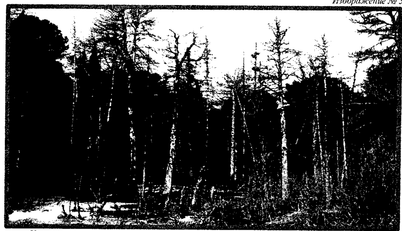
Кроме того, необходимо обратить внимание, что деревья, которые лежат на земле, но не имеют признаков естественного отмирания (имеют зеленую листву или хвою), определять как «мертвые» не допускается (смотри изображение N = 5).

Изображение № 4 Сухостойное дерево. Не является валежником Изображение № 5